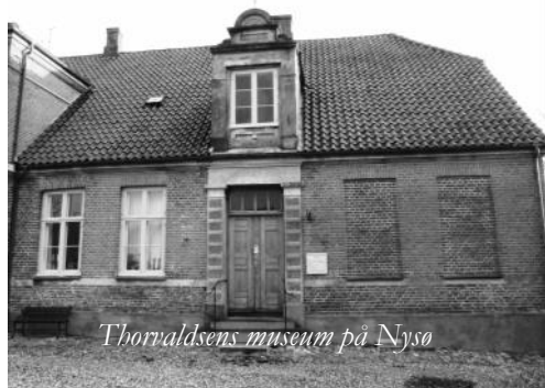
Thorvaldsens museum på Nysø

skulle betales af Præstø Kommune. Ingen af disse ærværdige institutioner eksisterer imidlertid længere. I dag er samlingen selvejende, og den drives med tilskud fra staten og Vordingborg