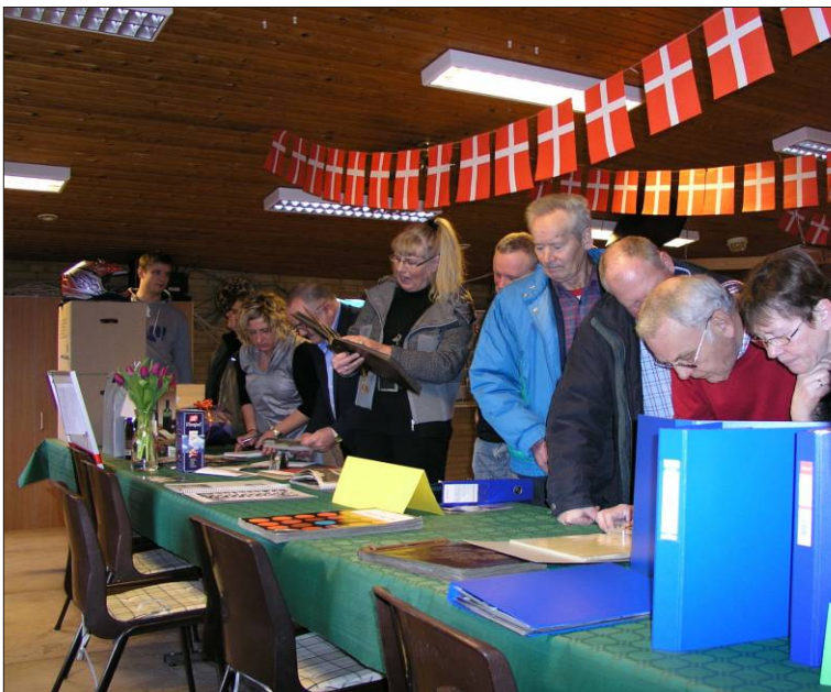
AUIF fik mange fotoalbums i gave. Og de vækker minder.