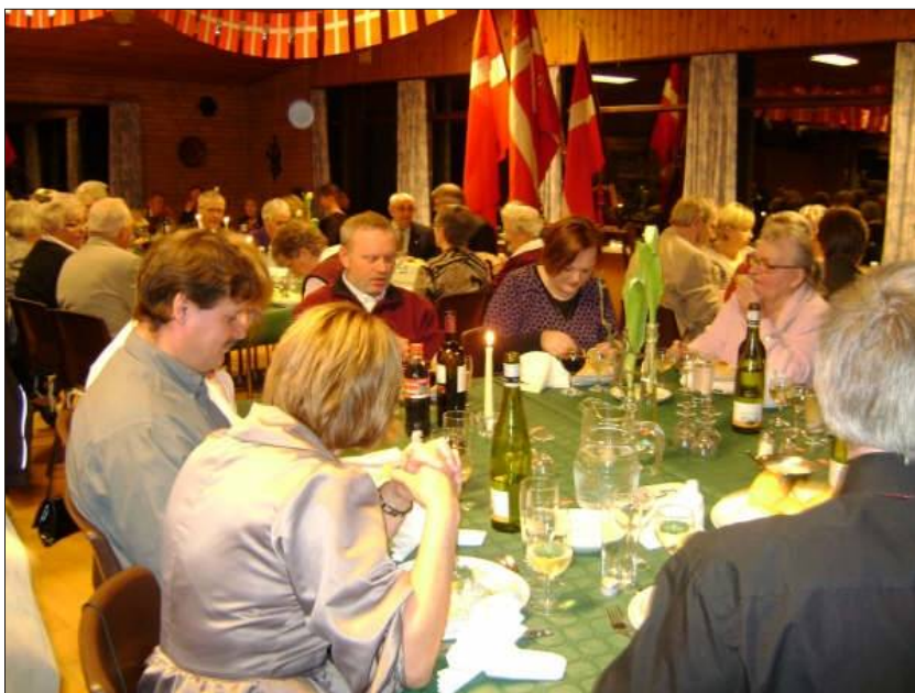
Klubbuset var fyldt med glade mennesker til festen den 23. januar