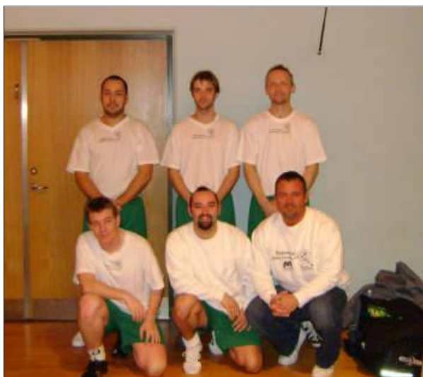
Old Boys indendørs anno 2008/2009 i deres nye tøj.