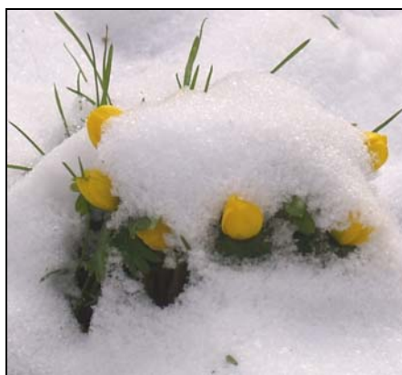
Billedet som pryder forsiden med de fine erantis er taget af Ove Rye Jørgensen.