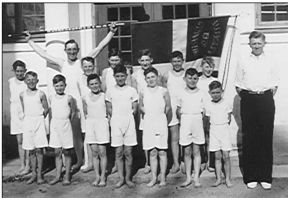
Allerslevs drengehold foran indgangen til Hotel Frederiksminde foråret 1940. Jeg står i forreste række ved siden af lederen.