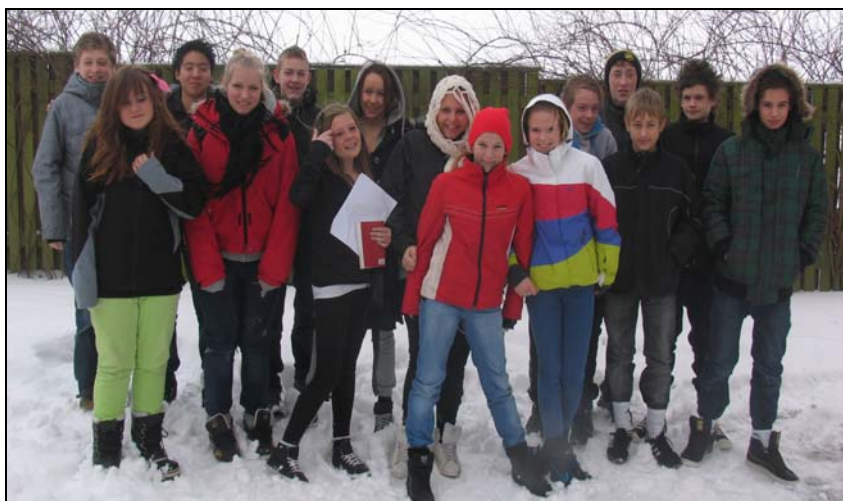
Her er de konfirmander, der gik til præst i Allerslev præstegård. Fire af dem blev konfirmeret d. 2. maj i Jungshoved Kirke.

Se mere på kirkernes hjemmesider: www.allerslevkirke.dk og www.jungshovedkirke.dk