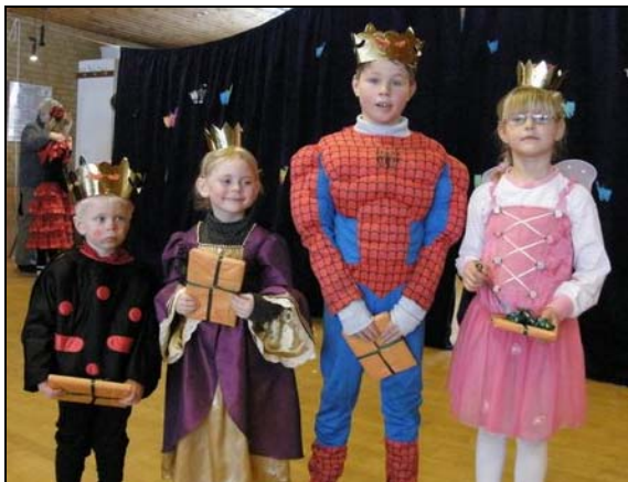
De glade kattekonger og -dronninger