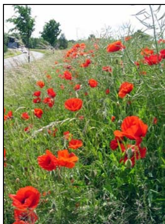
Billedet, som pryder forsiden, af de flotte valmuer er taget af Ove Rye Jørgensen.