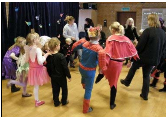
”Så tager vi venstre ben frem, og så ryster vi det lidt”

Alt i alt var det en rigtig hyggelig eftermiddag, og alle var enige om, at vi kommer igen næste år.