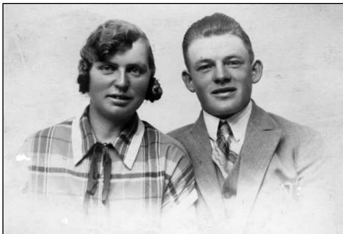
Mor og far omkring 1929