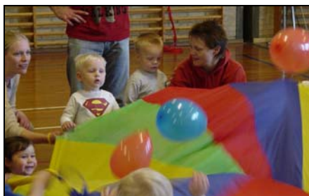
Mor, far og barn 0- 3 år.

Mor, far og barn 0-3 år. Tid: 10:00-11:00. Kontingent: 450 kr. Træner: Birgitte. Vi skal alle have det sjovt, børn og forældre. Vi skal krybe, kravle, trille, løbe, hoppe og frem for alt lege sammen med mor og far.