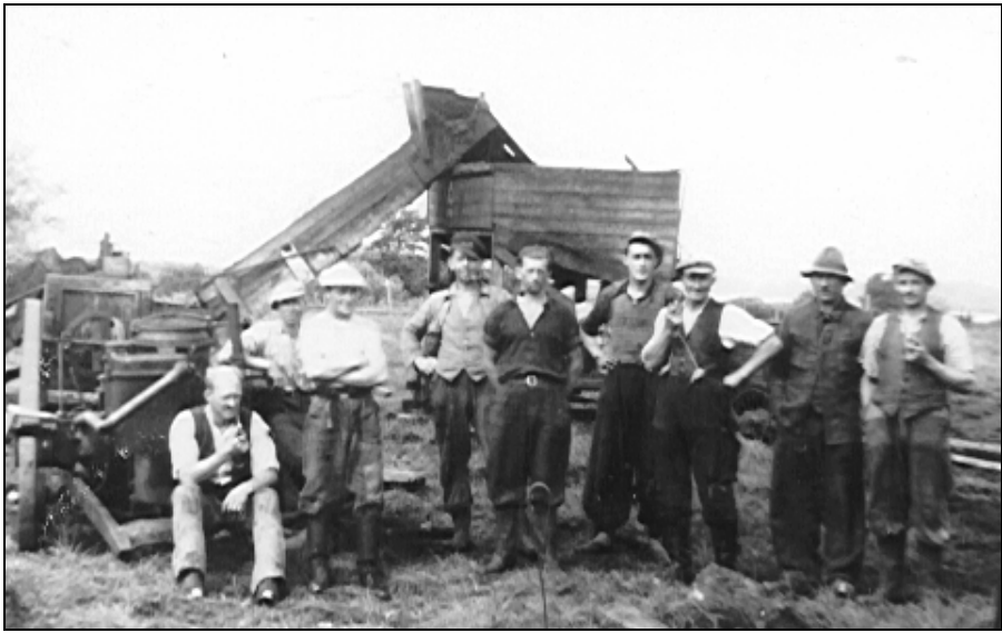
Far, nr. 3 fra venstre og hans arbejdskammerater i tørvemosen omkring 1942.

Som en slags bibeskæftigelse havde mor kontrol af arbejdsløse mennesker fra Dansk Arbejdsmands Forbund, som det hed dengang. Kontrollen foregik hver dag mellem klokken 9 og 10, hvor de arbejdsløse skulle komme og få et stempel i deres arbejdsløshedskort, og hvis de ikke kom, fik de heller ingen dagpenge. Det var så også mors opgave at anvise dem arbejde, hvis en arbejdsgiver havde henvendt sig til mor, far eller formanden for den lokale fagforening, og det var ikke alle arbejdsløse, der var lige interesserede i at blive sat i arbejde, og engang imellem måtte mor have hjælp af far eller formanden for at få dem til acceptere, at de skulle i arbejde.