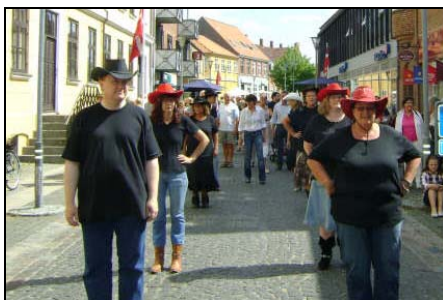
Linedancerne gæstede Adelgade i Præstø.