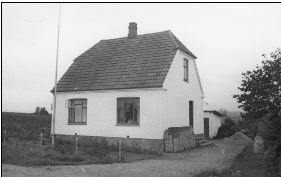
Mit barndomshjem i Allerslev. Mønvej 150.

I starten havde vi ikke elektrisk lys, men installationen var forberedt, det vil sige, at der var indhugget rør og underlag til afbryderne i væggene og rørene var ført til lampesteder i loftet således, at der kunne trækkes ledninger på et senere tidspunkt.