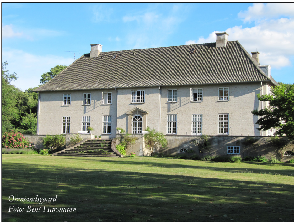
Oremandsgaard