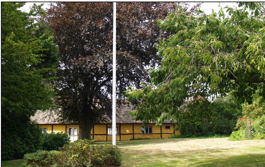
Svanegården fra haven 2010.