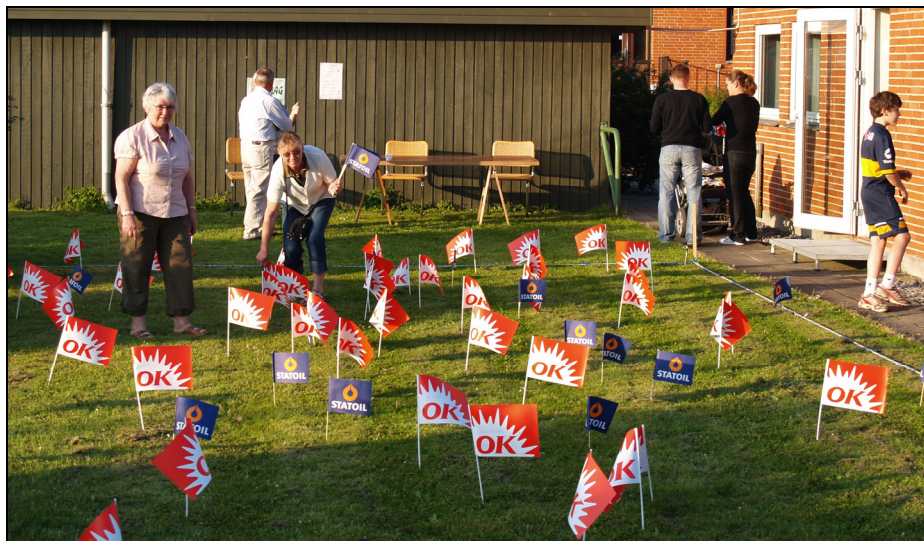
Plant et flag er nu tradition ved året Skt. Hans