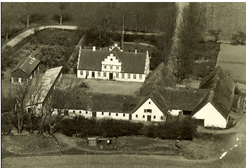
Arkivfoto fra lokalarkivet i Præsto. Overdrevsgården fra ca. 1950 – 1955.