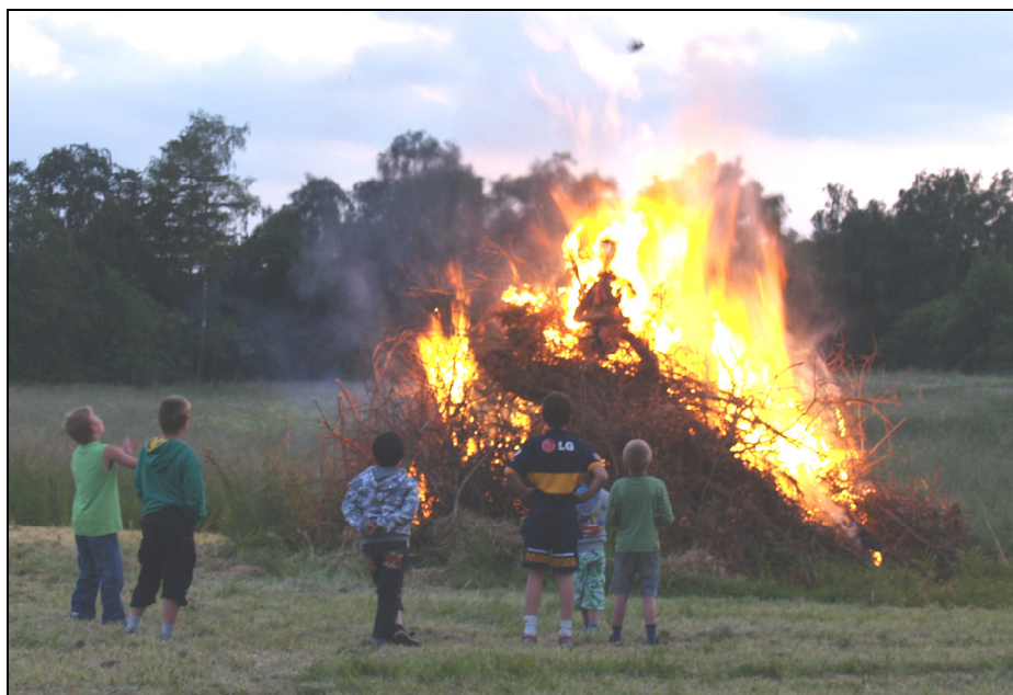
Der er nu ikke noget som at varme sig på bålet.