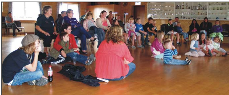
Som noget nyt i år var der også dukketeater hvor både børn og voksne kunne kigge med.

Hele arrangementet var berammet til kl. 10 – 16, men da vejrguderne kl. 15.40 lukkede op for sluserne og lod den strålende sol afløse af silende regn var det for både deltagere og arrangører et helt naturligt tidspunkt at stoppe festlighederne på. Men vi er mange, der allerede nu glæder os til næste års Landsbytræf, for netop ved begivenheder som denne, har vi mulighed for at mødes og sludre med folk, som vi måske ellers ikke møder så tit i hverdagen.