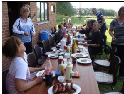
Der blev grillet og festet med alle forældrene.

Udendørs træningen sluttede torsdag i uge 43, men allerede lørdag i samme uge startede indendørs træningen, med træningsdag hver lørdag fra 9:00-10:00 i Langebækhallen. Alle er velkommen, og skulle der være nogle spørgsmål vedr. ungdoms fodbold i Allerslev, så tøv ikke med at kontakte Konstantin 25 25 17 41.