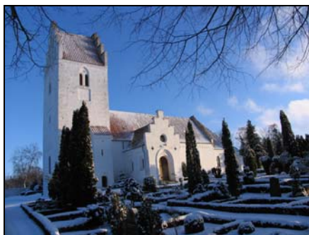
Billedet, som pryder forsiden, er et billede af Allerslev Kirke.