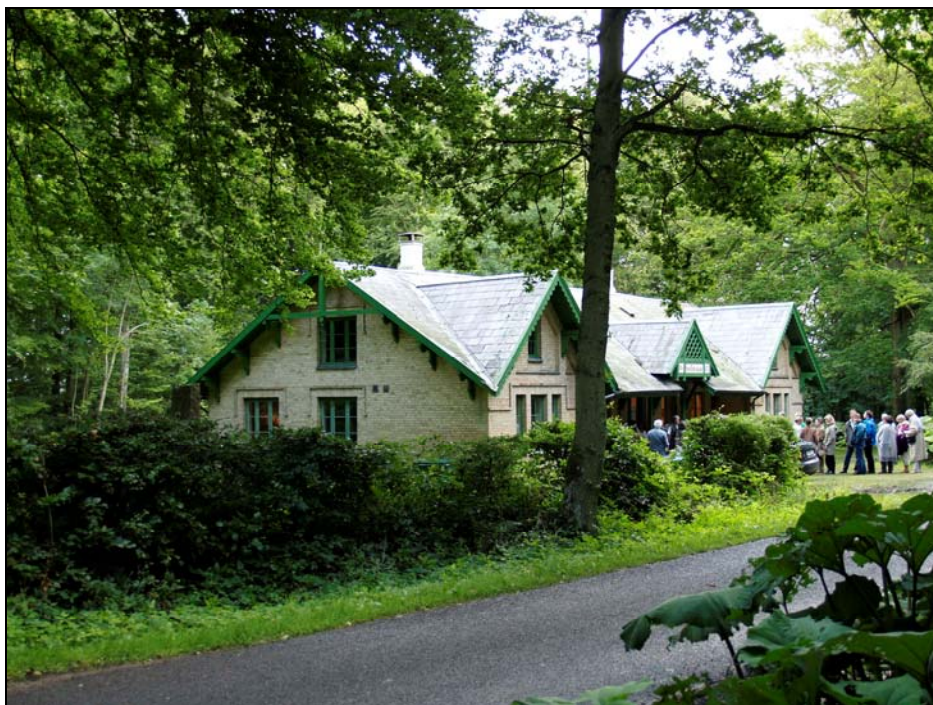
Husflidsskolen i Kragevig Skov

En koncert der strækker sig over en hel uge, og som er en meget velbesøgt med publikum fra det meste af Sjælland, besat med professionelle unge lovende musikere. Som en sidegevinst, har publikum mulighed for i pausen, at nyde en forfriskning og evt. sandwich ude i det fri, mens skoven er ved at gå til ro. En koncert midt i skoven jeg kan anbefale på det varmeste, det er et rigtig flot arrangement og i meget smukke omgivelser.