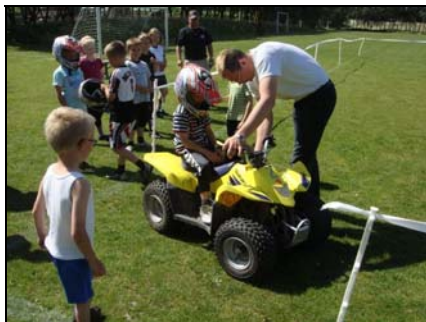
ATV kørsel for børnene ved sommerfesten

Vi har endnu ikke tilmeldt årg. 03-04 til turnering, men det påtænkes at gøre det til foråret.