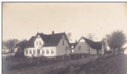
Ellebæksgård før 1952