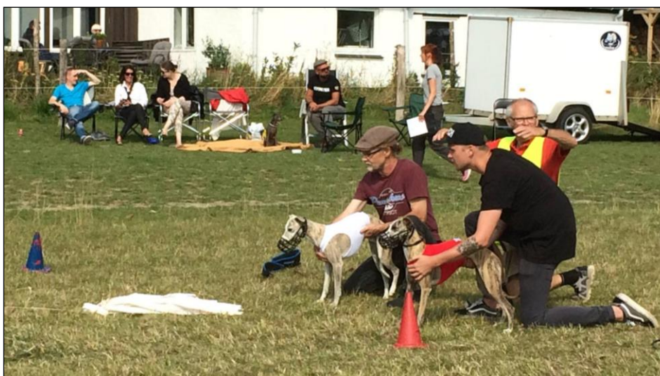
Der gøres klar til løb. Haren skal nå lidt ud før hundene slippes løs.

Banen på marken var indrettet med mange skarpe sving, og hele ideen med løbene er at hundene får trænet deres naturlige instinkt i jagt! Mynder er nemlig opdrættet til bla. harejagt, og derfor gives der point efter hvor godt hundene samarbejder om at fange ”haren” (som her er plastik trukket af en wire), og samarbejdet går ud på at afskære hjørner og forudse harens flugt. Nogle racer skal dog bedømmes alene da de jager solo. En del af setuppet er også at have ting der kan distrahere hundene fra deres job, og derfor var banen fuld af dejlige hestepærer, der for enkelte hunde, lugtede langt bedre end den der plastikdims.