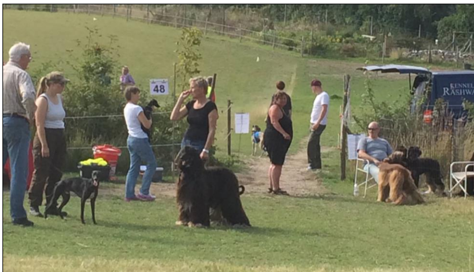
Mange smukke hunde var mødt op på dagen