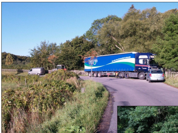
Fra jylland Kl. 5,30 og ved grusgraven kl.9