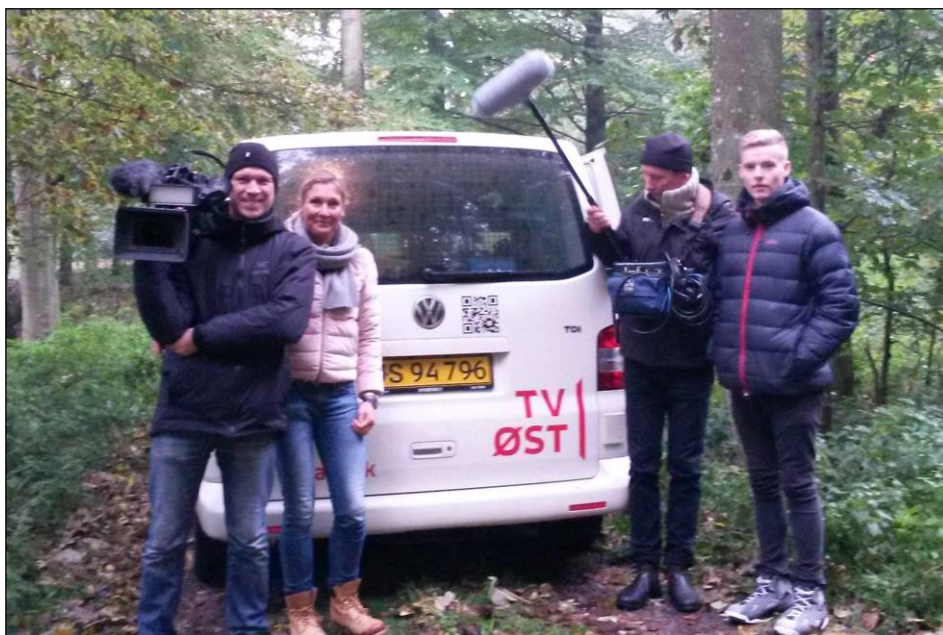
TV-holdet ved Galgebakken

TV2 Øst bilen rullede ind hos os som ventet fredag morgen - og ud hoppede tv-holdet bestående af interviewer, kameramand, lydmand og en ung praktikant. Hurtigt mærkede man holdets effektivitet - og ikke mindst professionelle lyst til at præsentere byen fra den bedste vinkel, på trods af vejrgudernes heldagsregn!