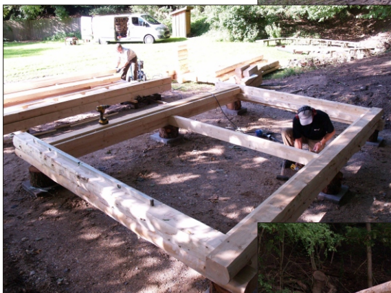
Bunden er lagt kl. 10,30