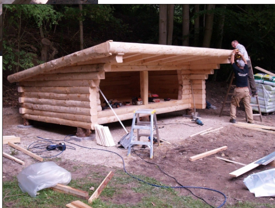
4) Næsten færdig kl.14