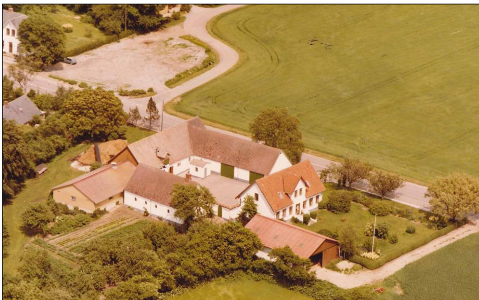
Ellebæksgård efter 1952

Forskolen bag træerne yderst til venstre og skråt over for ligger hovedskolen. Den åbne plads ved siden af blev oprettet som legeplads for skolen. Tidligere lå den foran skolen, men blev flyttet i forbindelse med at den nye vej til Kalvehave blev anlagt omkring 1951 og som går lige forbi huset.