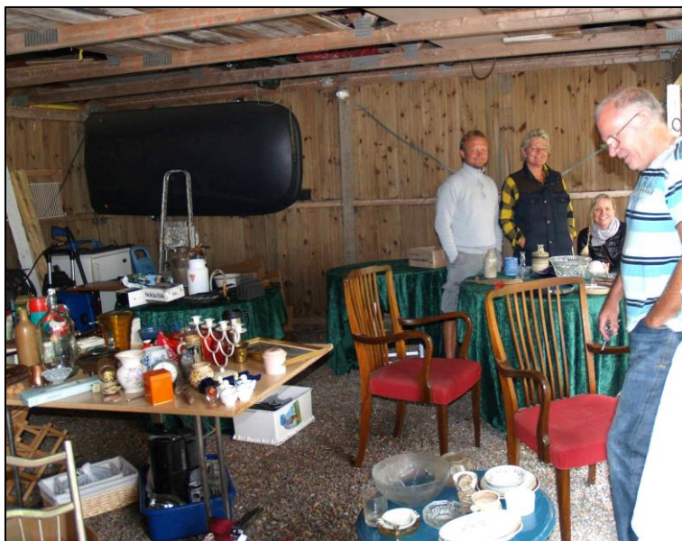
Stadig gæster, trods regnen her på besøg hos Karlsbøj