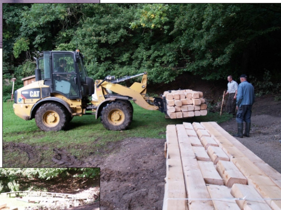
Tvingbro lagde traktor til, for at få materialerne ind i grusgraven