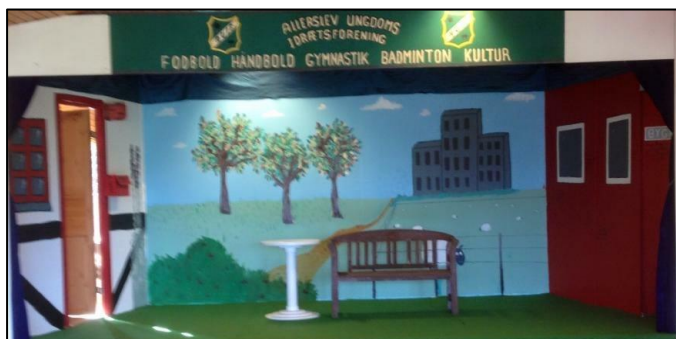
Scenen står allerede klar til årets dilettant