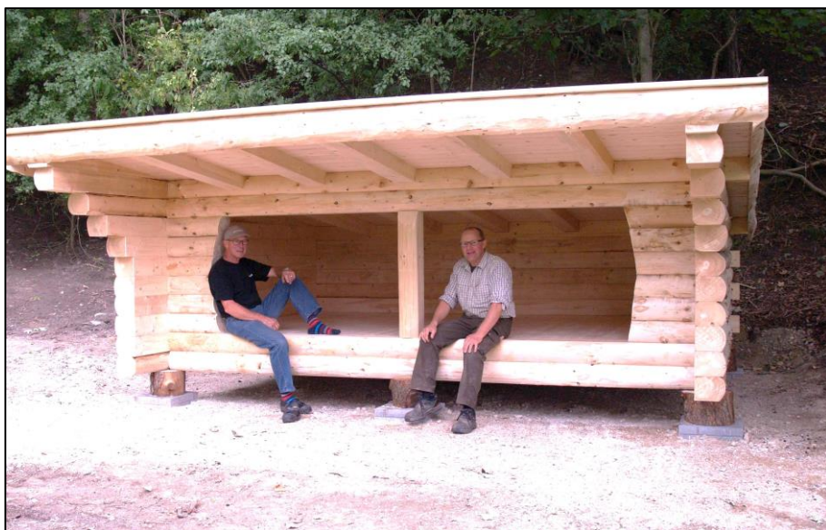
Huset er færdigt og arbejdsholdet er klar til afgang mod Silkeborg kl. 15,15 – sådan!

Lad os håbe at vore gæster i grusgraven er naturfolk, der passer på naturen og dermed beroliger de frygt-somme.