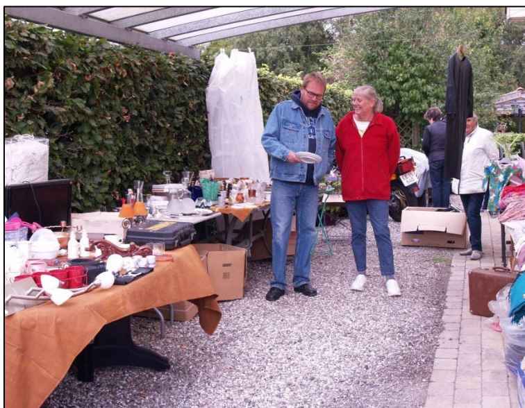
En 'blandet landbandel', her var både 'løpper', syltetøj og honning