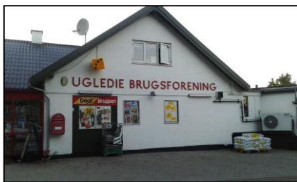
Ugledie Brugs

Noget jeg f.eks. gerne ville have sluttet af med at sige, var at nu håbede jeg at have præsenteret Ugledige som en nutidig, levende landsby med mange ildsjæle - og et opland, der støtter helt fantastisk op (og tusind tak for det)! Specifikt at have fået nævnt, at det praktisk taget var en ildsjæl, der gik fra dør til dør for at sikre, vi fik fibernet til byen; samt at folk kommer fra nær og fjern og går skov og sø rundt på 1 time. Nancy nåede ikke at nævne, at Brugsen planlægger en bake-off, så de selv kan lave frisk morgenbrød og brød dagen igennem - og at åbningstiden derfor vil blive tidligere, når bake-off'en er på plads.