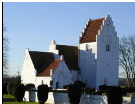
Jungshoved Kirke

Anden gang er d. 13. nov. i Rejsestalden ved Jungshoved kirke, hvor vi begynder med morgenmad.