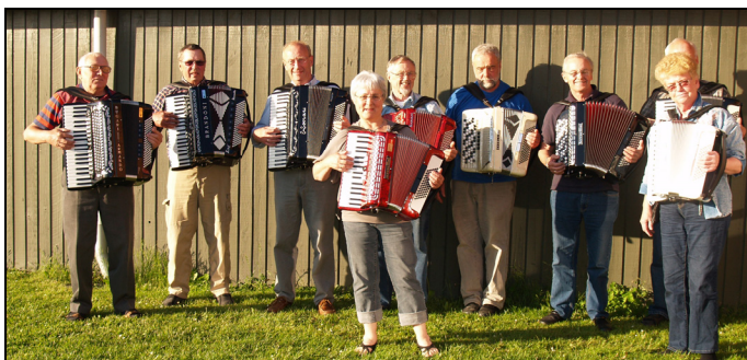
Onsdagsholdet – Harmonikaspillerne Allerslev