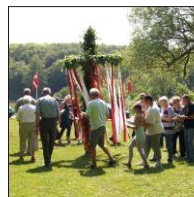
Dans om Majstangen