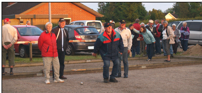
Petanquekuglerne blev også luftet