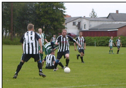
Old boys i kamp mod Langebæk

Jeg håber, at der en dag bliver spillet fodbold i Allerslev igen, om det så kræver en sammenlægning med en anden klub, så må det kunne lade sig gøre.