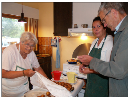
Traditionen tro var der æbleskiver til Skt. Hans aften.