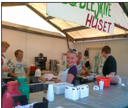
Der var roligt i ableskivehuset grundet det varme vejr.