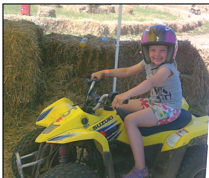
Så skal den have lidt "gas"