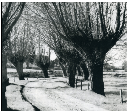
De gamle piletræer langs vejen

Den gamle Mernvej, er den sidste rest af den gamle vej fra Præstø - Skibinge over Allerslev til Kalvehave og overfart til Møn. Indtil for få år siden stod der i begge vejsider 20 til 25 gamle piletræer, flere hundrede år gamle.