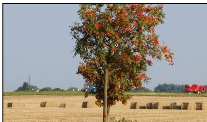
Forsidebilledet af rønnen her er taget på Lydehøjvej.