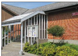
Auif og trygheden