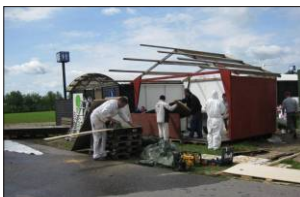
Opsætning på Roskilde Dyrskue