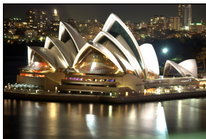
Operabuset i Sydney