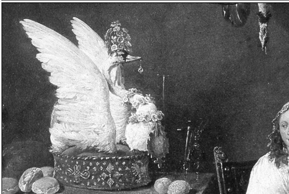
Svanepostej arrangeret som en skueret. Udsnit af historisk maleri

Ind på fadet de bærer mig Vingernes afmagt lærer jeg Glimtende tænder begærer mig Stakkel osv. 5