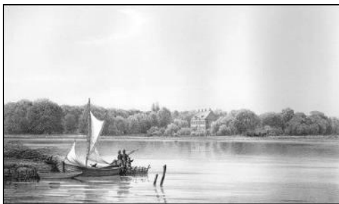
Papirklip af H.C. Andersen og litografi af Nysø fra midten af 1800-tallet

smukke landskab. Ind imellem tælles der svaner på markerne nord for Nysø. I øvrigt var det på selv samme Nysø, at H.C. Andersen blev inviteret til godset Gisselfeld, hvor han – Der dänische