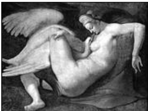
Maleri af Leda og Svanen