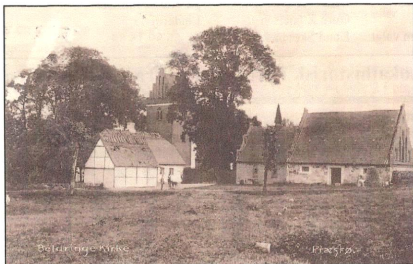
Beldringe Kirke – år 1916 efter poststemplet. sen.