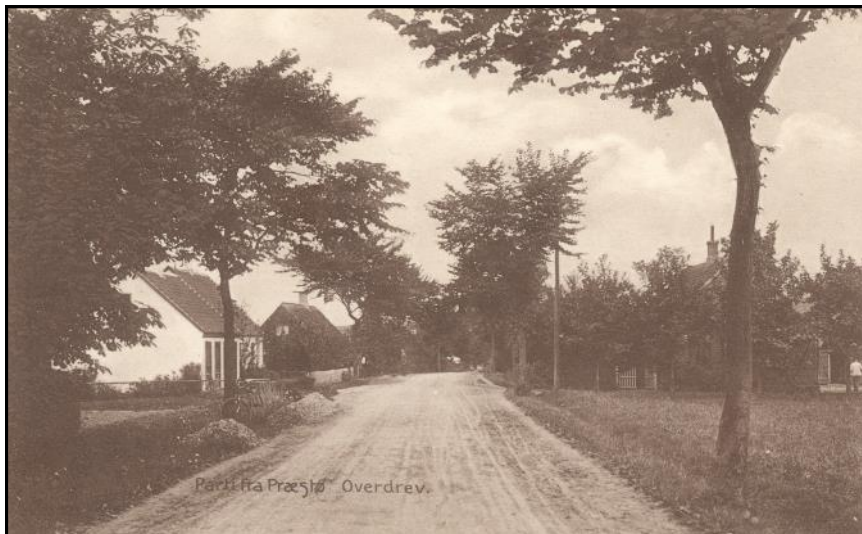
Præsto Overdrev. Vejen der drejer af til højre er nok indkørslen til 'Skovlykke Mejeri'.

og da han kom til Trehjørnehuset, drejede han mod Nysø.