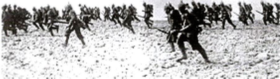
Tysk infanteri under fremrykning i Belgien den 7. august 1914.

Krigen medførte to centrale problemer for den danske radikale regering. Det ene omfattede Danmarks neutralitetspolitik, det andet styringen af markedet. 11 Neutralitetspolitikken var en konsekvens af nederlaget til Tyskland i 1864, og dens udførelse var en balancegang på en knivsæg for at