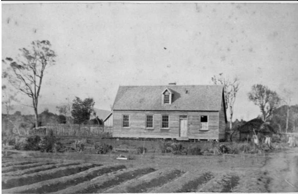
Monrads beskedne hus i New Zealand

For en nutidig betragtning ville det engelske forslag om en delingslinie af Slesvig omtrent hvor grænsen går i dag have været en rimelig løsning. Det ville i hvert fald have sparet de 3100 danske soldater, der blev enten dræbt, såret