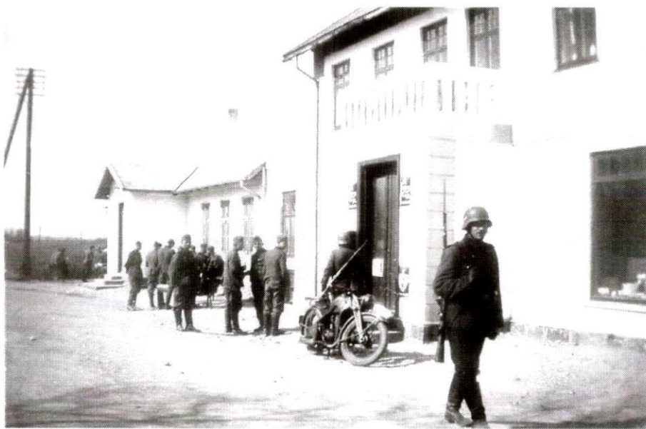
Tyske soldater ved Brugsen i Baarse 9. april 1940

stret og hjemsendt. Tyskerne forlangte nu indkvartering af deres soldater, dvs. ca. 30 i Skibinge by. Indkvarteringen varede 2 - 3 måneder, og den betød, at mange måtte forlade deres stuer og lægge halm på gulvet. Senere på foråret blev Præstø besat. 120 tyske soldater kom til byen og blev indkvarteret på Teknisk skole i Jomfrustræde. I 1944 rykkede en underafdeling af Gestapo ind på Hotel Danmark, hvor nu Sportigan har butik.