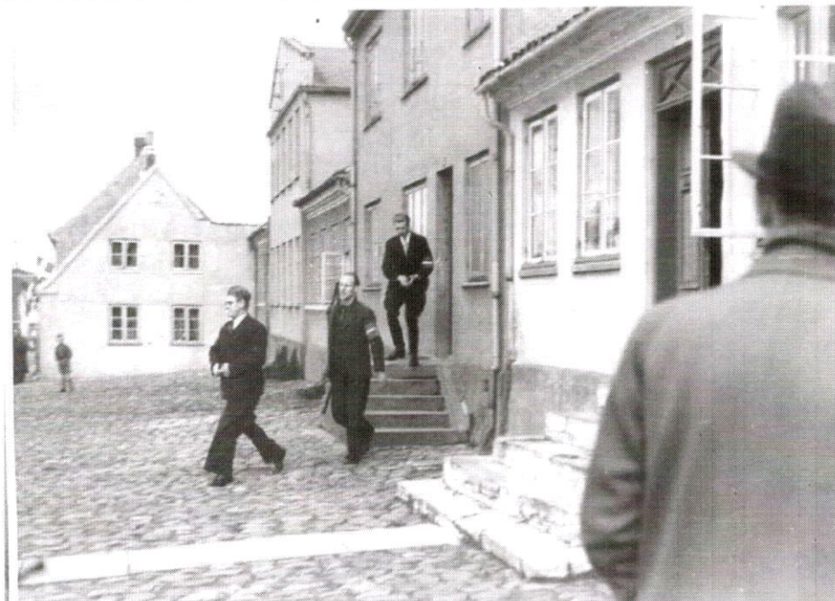
Arrestation af en værnemager

De sidste par år af krigen stod det mere og mere klart, at Tyskland ville tabe, og