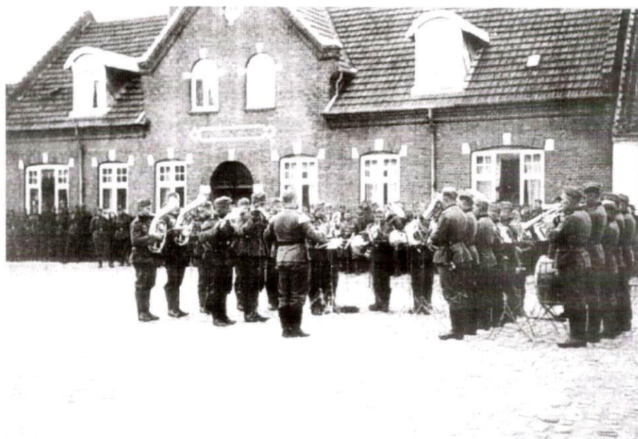
Tysk militærmusik på Torvet

ligt mange LS-medlemmer (Landbrugernes Sammenslutning, opr. en faglig forening senere nazificeret) og derfor også rekrutteret ca. 30 Frikorps Danmark soldater, så der har været god grund til forsigtighed ikke mindst efter Gestapos ankomst i 1944.