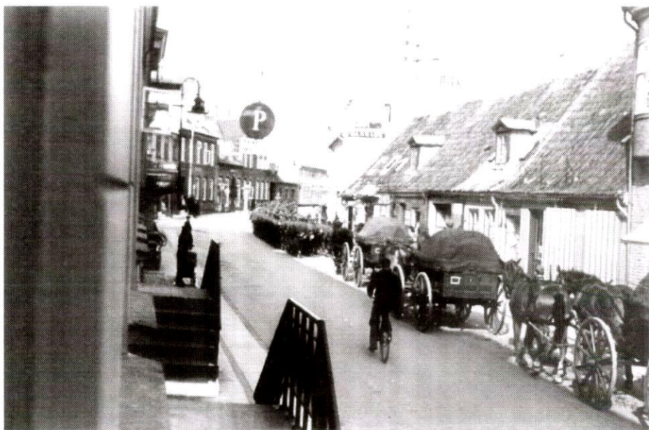
Tyske soldater og køretøjer i Adelgade

er der ingen beretninger om voldelige episoder mellem tyskere og lokalbefolkningen.