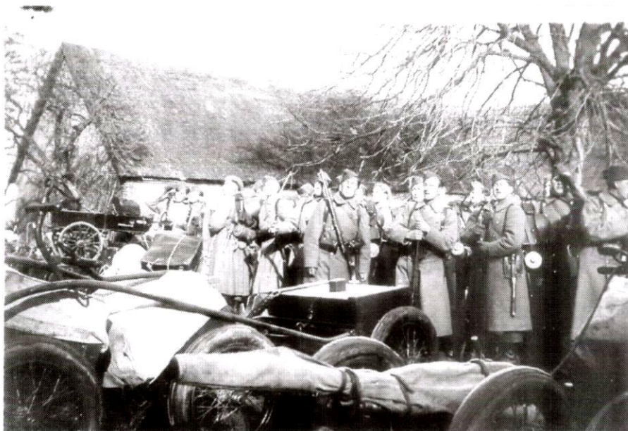
Danske soldater i Baarse Præstegård 9. april 1940