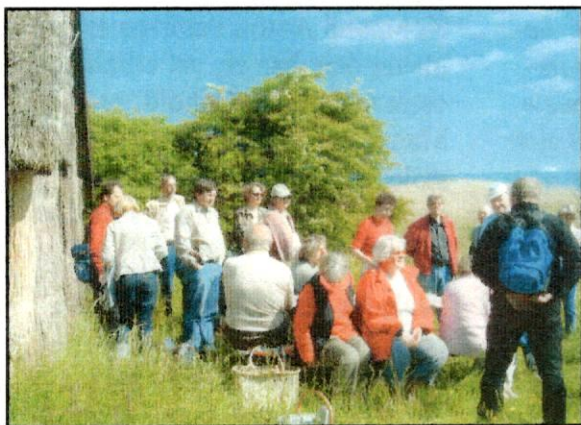
Udsnit af medlemskredsen ved Kragevig.