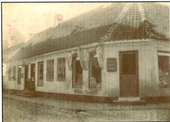
Garvergården, Adelgade 61, 1903, fotograf ukendt.

Det eksempel, der skal fremhæves her, er et par billeder af 'Garvergården' - et foto Erling tog 1950 samt et ældre