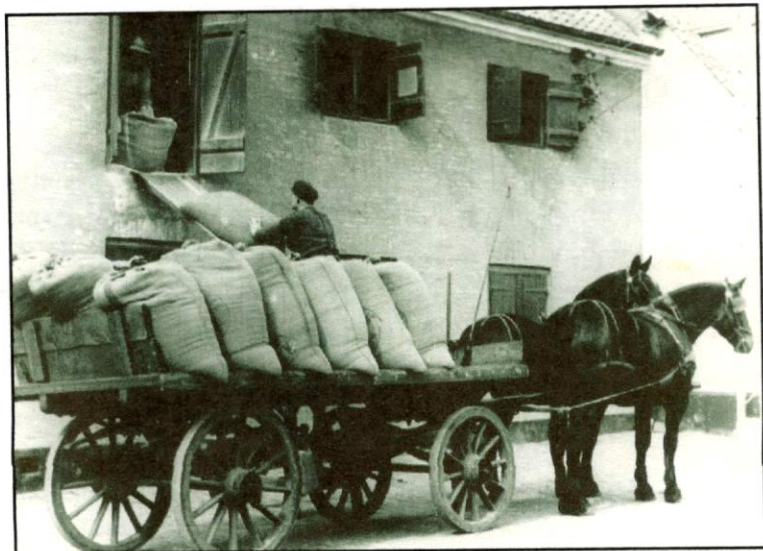
Sække læsses på vogn i Torvestræde (Storegården).