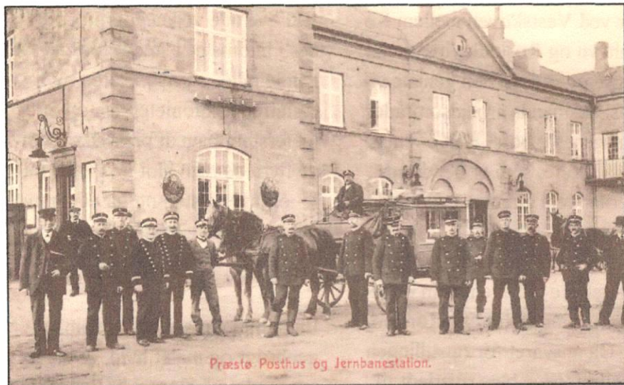
Præsto Posthus og Jernbanestation. Postkort fra tidligt i 1900-tallet. Præsto Lokalkiv B1380.