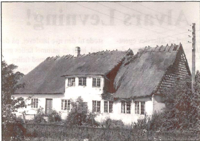
Birkedommerhuset Rekkendevej kort for den østlige ende fjernes.

medstifter af og initiativtager til Missionshuset, som også kom til at ligge på Mønvej.