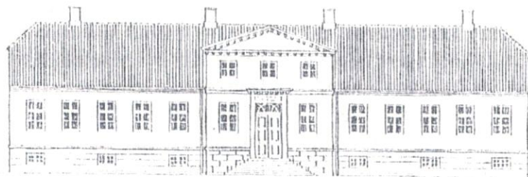
Pederstrups hovedbygning Rekonstruktionsforslag af arkitekt Peter Bering 2001

Tegningen kopieret fra brochure fra Reventlow-Museet Pederstrup.