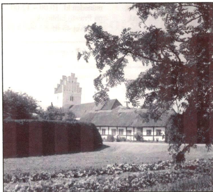
Allerslev Kirke. Tilgæet arkivet 1991.