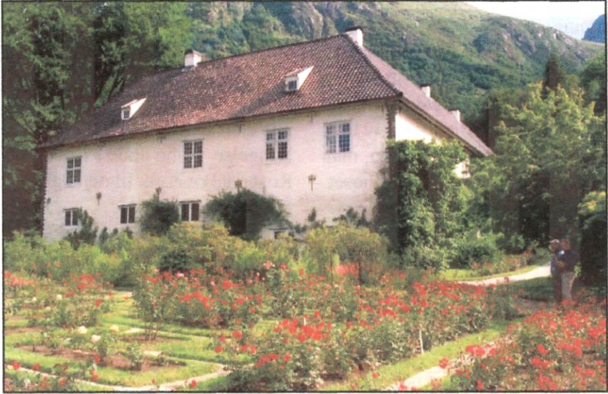
Den smukt beliggende hovedbygning og rosenhaven.

Forord: Rosendal har altid haft en stærk tilknytning til Danmark. Der har været forbindelser til flere danske slægter.