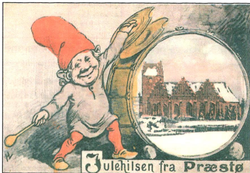
Julen nærmer sig. Her Præstø Kirke som spejlbillede i den store tromme. Udgivet af Andreas Jensen omkring 1910.