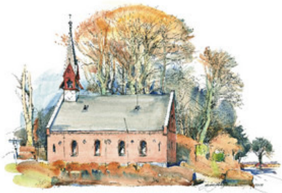
Sankt Peders kapel ved Sjolte