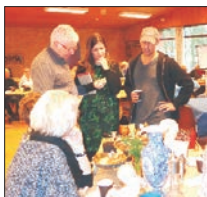
Mit kærestes øje s.10