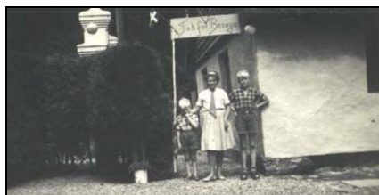
Traktørstedet ved den gule port