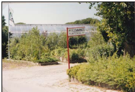
Indgangen 1995, nu P-plads