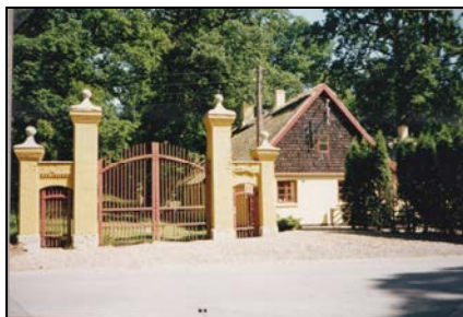
Lerhuset anno 1995

jægerhytte. Små 100 m fremme kommer man så til den asfalterede vej.