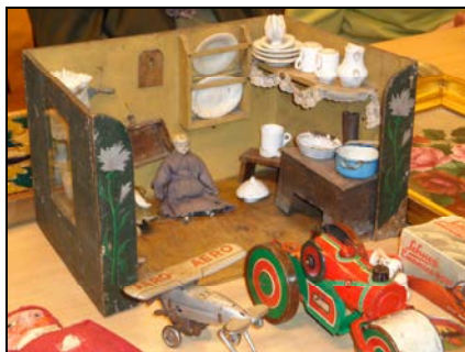
Et dukkehus fra omkring 1900

Disse var så enkelte af højdepunkterne, for der var mange og dem der ikke nåede at komme med i udsendelsen, blev efter optagelsen vurderet af Steffen Dinesen.