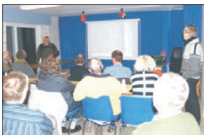
Hvem bruger skolen s.15