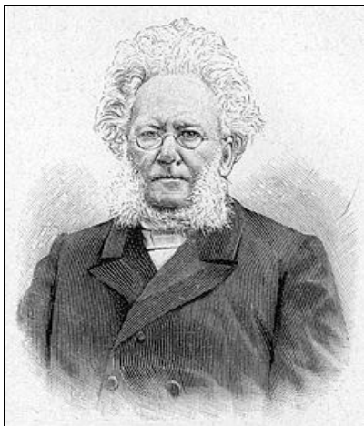
Henrik Ibsen (1828 – 1906)

Henrik Ibsen – kvinderne, oprør i hjemmet, det nye, det moderne liv og samliv, Præstegården, tirs. d. 2. april kl. 13.