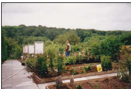
Søren i gang med nye bede