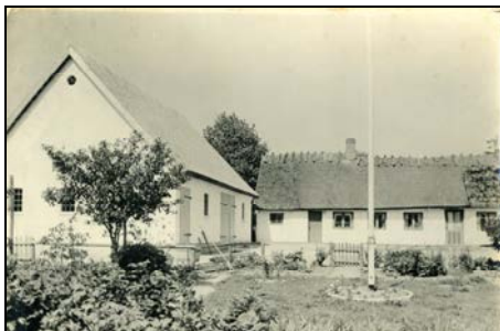
Bondehuset fra ca. 1965