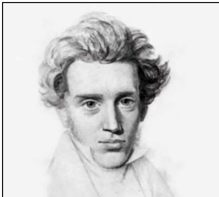
Søren Kierkegaard (1813 – 1855)

Foredrag ved Pia Søtoft d. 27. feb. kl. 19.30 i Rejsestalden.