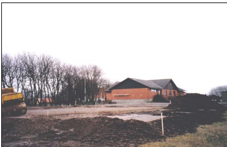
De første baner er ved at blive anlagt