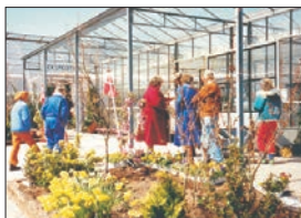
En virksomhed i sognet s. 16