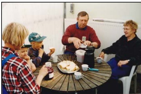
Næsten 3 generationer