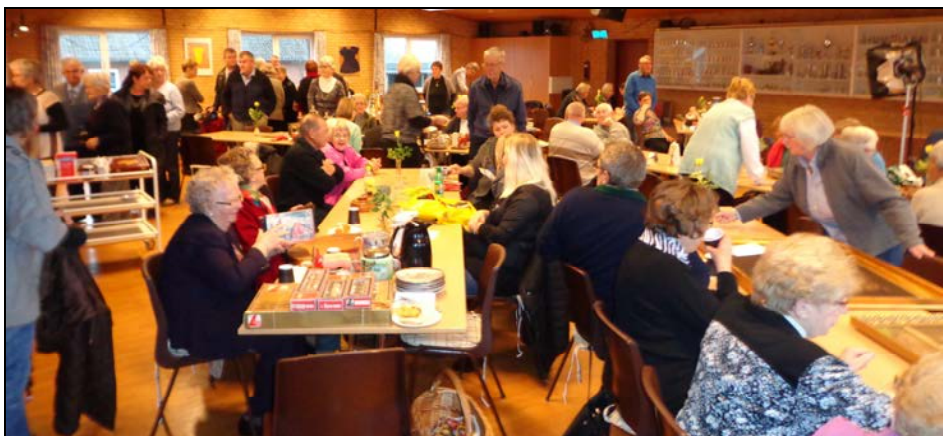
Der var mødt omkring 70 interesserede op til "Mit kæreste øje".

Optagelsen stod på i 3 stive timer med en pause, og i den tid skulle der være rimeligt stille. Mobiltelefonerne skulle slukkes, og hvis det skete, skulle vedkommende give en omgang til hele salen, og den kunne blive dyr. Til din oplysning bliver udsendelsen sendt den 28. januar, 4. februar og 11. februar på TV2 øst, kl. 19.45 og med genudsendelse om onsdagen kl. 18 og 21.45 så glæd dig.