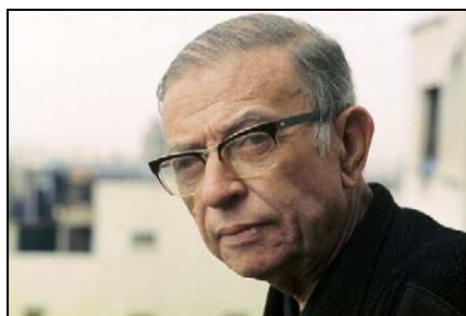
Jean Paul Sartre, (1905-1980)

'Livet leves forlæns, men må forstås baglæns'. Dette kunne være skrevet af Kierkegaard, men er titlen på en bog om Kierkegaard.