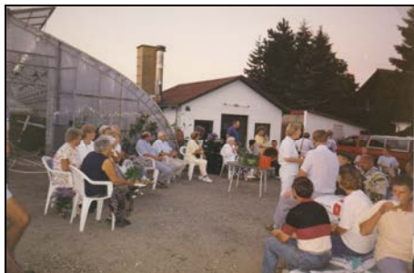
Aftenarrangement på planteskolen