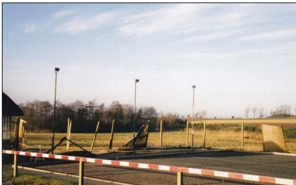
Orkanen 1999 lagde begnet ned