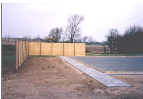
Banerne klar til brug

I december får vi en orkan ind over Danmark. Alle vores flethegn bliver blæst omkuld og det hele lander på sportspladsen. Nu må vi starte forfra med læhegnet.