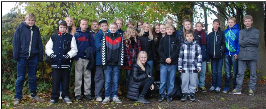
Konfirmationsholdet foråret 2013

Gudstjenesten er således tilrettelagt for og med kammerater, venner, familie og alle andre.