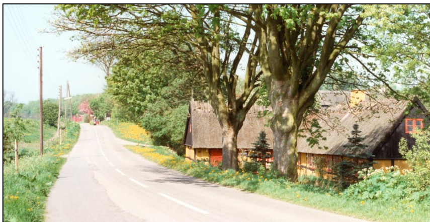
Ugledigevvej 42, maj 1992

Det første år jeg boede i Ugledige, inviterede de mig til Nytårsaften. Det var hyggeligt, med dejlig mad og kager. Da det var ved at være tid til at byde det nye år velkommen, susede Kirsten pludselig ud af stuen, og kom et øjeblik efter ind med dagens