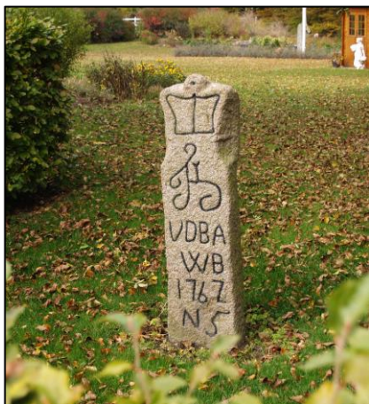
Vildtbane stenen ved Rones Banke 40

I dag er der kun et enkelt hus uden for Beldringe gods. Landsbyen er der ingen spor af.