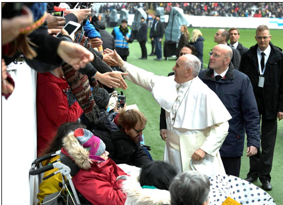
Pave Frans 2 besøg ved Lund i 2016

For den katolske kirkes interesser retter sig andre steder hen end til det kolde Nordeuropa. Pave Frans er meget mere optaget af den katolske kirkes globale problemer. Det gælder kirkens rolle i Sydamerika, hvor han jo selv kommer fra, forholdene i Afrika og Sydøstasien. Her vokser den katolske kirke, ligesom befolkningernes problemer vokser. Og i det lys kommer den gammelkendte lutherske kritik af den katolske kirke langt ned på listen over emner, paven skal bruge sin tid på. Det er for paven at se en detalje, som sikkert