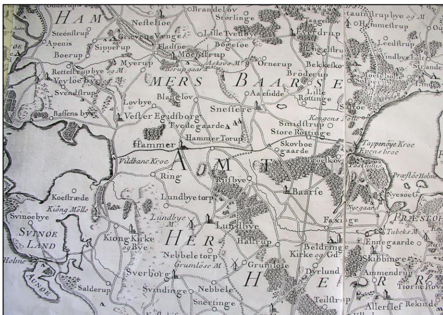
Nordeuropas største vildtbane

I hver ende af banen blev der rammet pæle langt ud i vandet, for som et solidt pæleværk at holde dyrene inde. Kromanden på Tappernøje kro skulle passe på det østlige led ved Stiggærdet og kromanden ved Vildtbankroen skulle passe leddet der og sørge for at lukke efter gennemkørsel, så vildtet ikke kunne forsvinde.