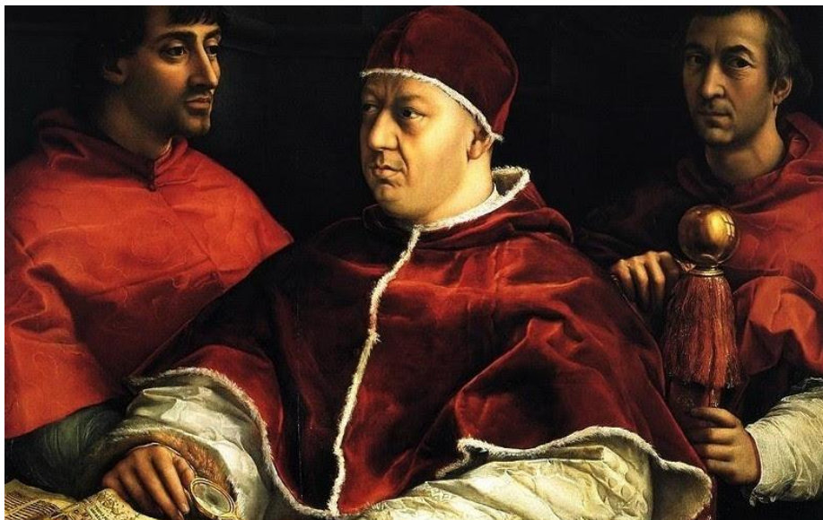
Luthers pave – Pave Leo X (1475 - 1521)

For Luther var 'Guds nåde' - og i dag vil vi sige 'Guds kærlighed' - ikke noget, der skulle eller kunne forval-