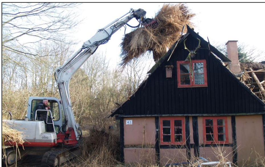
Ugledigevej 42, nedrivning efteråret 2016 -

Huset forfaldt med skimmelsvamp til følge, kom på tvangsauktion og blev i 2016 revet ned.