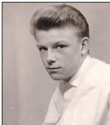
Jeg som 17 år, 1960