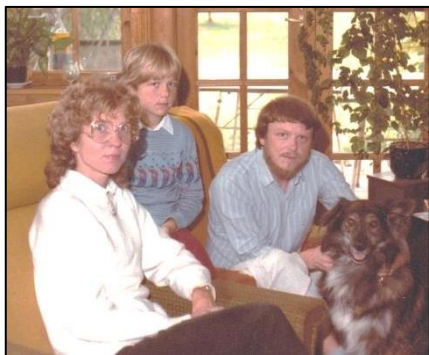
Familien i Brønshøj 1980