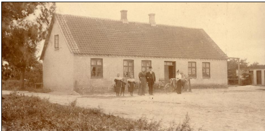
Ugledige skole ca. 1900-1910

Omkring 1953 blev skolen lukket og børnene flytte til Allerslev skole der den gang lå på Mønvej 120. Men den brændte i 1977 og blev senere igen opført på Enghavevej 2, lige over for AUIF's klubhus, men det er en helt anden historie, og den gemmer vi til præsentationen af Allerslev skole.