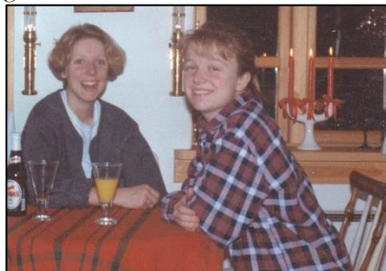
Mine døtre 1993