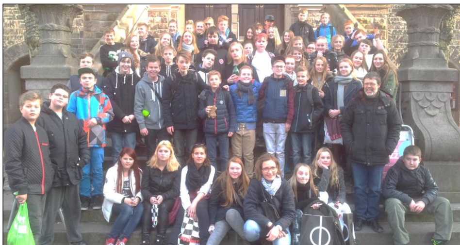
Det store hold konfirmander for 2015 fra Præstø, Skibinge, Bårse, Beldringe Allerslev og Jungshoved foran Eliaskirken på Vesterbro Torv.