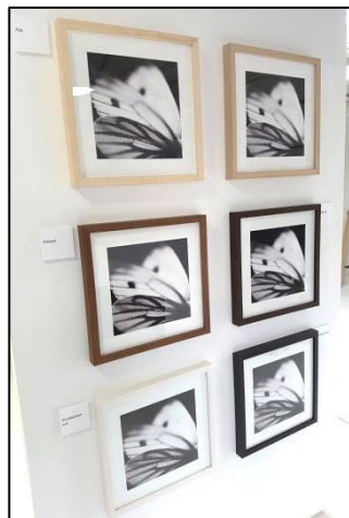
Der findes flere måder at udstille billeder på og derudover har de også et fint udvalg af rammer.