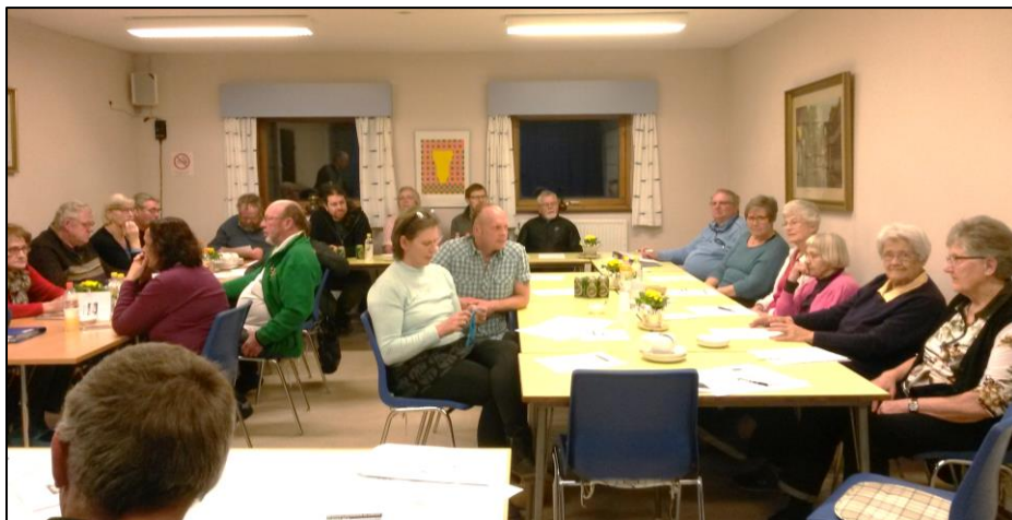
Der var mødt godt 30 mennesker op til generalforsamlingen i beboerforeningen