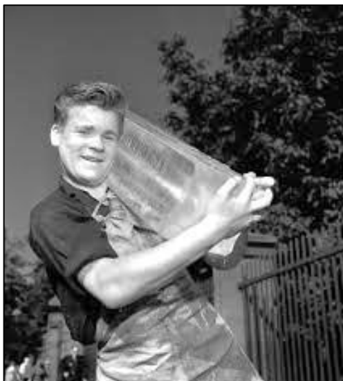
Arkivfoto: Levering af isblok til isskab