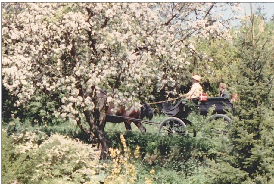
Arkivfoto – En forårsdag i Ugledige (ca. 1991)

Når musikerne har givet et par numre, og folk har suppleret med deres egen stemme, er det tid til at tage turen omkring den smukke Majstang.