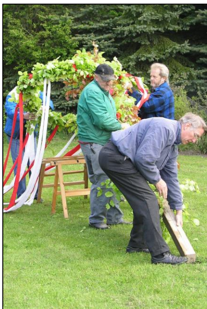
Så skal der løftes