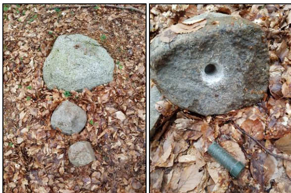
En helt almindelig sten, kan måske indeholde en lille skjult logbog.

Kunne du tænke dig at vide mere, så kan du læse meget mere om geocaching på www.geocaching.com God Jagt!