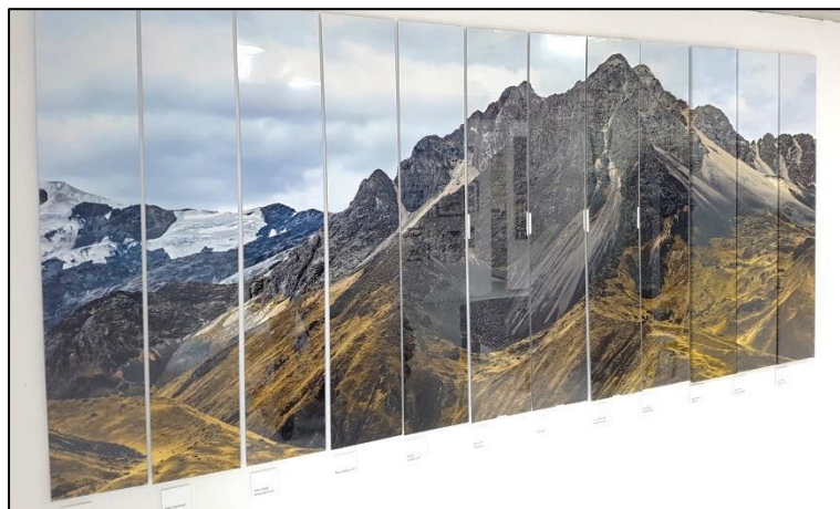
Hver af det 12 dele, repræsenterer en måde at lave tryk på.

For at skabe så flotte resultater, kræver det også noget ordentlig udstyr. Her er et par meget flotte printere der stod og tronede bageste ved show-room.