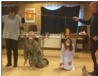
Der blev også bidt til bolle til fastelavn.