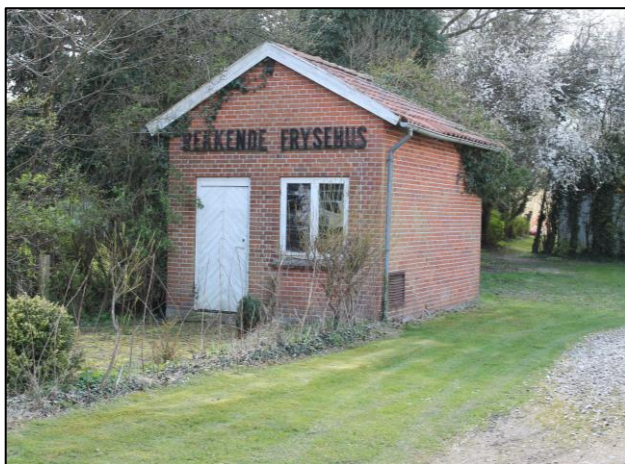
Frysehuset i Rekkende 2017

Hun havde set det lille tilgroede hus på Nebblevej og tænkt, at det kunne opfylde hendes behov for en lille forretning. Frysehuset var annonceret til salg for 30.000 kr. – og en dag kørte hun derud med ejendomsmægleren. Det var en oplevelse, vi måtte bryde ind i huse, for ingen havde nøgle til huset. Indenfor stod der en gammel kompressor og nogle salttønder og sildekasser fra den tidligere bruger. Men da vi fik ryddet op og rensed ud i ukrudtet, viste det sig, at der faktisk var adgang fra amtsvejen med en pæn indkørsel med fliser, hvor jeg her i